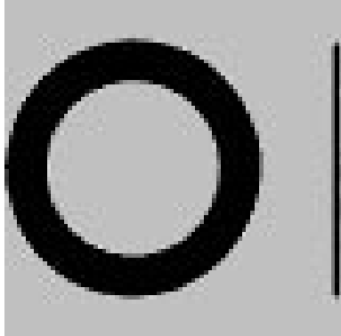
12X18X 1 DIN 988 SEEGER - Passscheibe DIN 988 Stahl P Paßscheiben